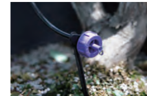
ボタンドリッパー つゆ草シリーズ