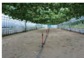
ポータブルセットを利用したブドウのかん水