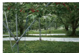
ハンガースプレーセットによるサクランボのかん水